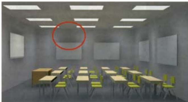
Εικ. 1 Προσομοίωση με φωτιστικά που φέρουν πολυκαρβονικό κάλυμμα ευρείας κατανομής

Στο παρελθόν έχουν γίνει διάφορα λάθη κατά την εκτίμηση του τρόπου με τον οποίο θα πρέπει να φωτίζεται μια αίθουσα. Στις σχηματικές αναπαραστάσεις μπορούμε εύκολα να διακρίνουμε τα μειονεκτήματα και τα πλεονεκτήματα των μεθόδων που χρησιμοποιήθηκαν. Στην εικόνα 1 έχουμε την προσομοίωση μιας μεθόδου φωτισμού με ευρεία χρήση κατά την δεκαετία του 1970 με φωτιστικά σώματα με διαχύτη (diffuser). Με αυτόν τον τρόπο έχουμε μια αρκετά ομοιόμορφη κατανομή του φωτός, τόσο σε οριζόντιο όσο και σε κάθετο επίπεδο. Ταυτόχρονα όμως χάνονται οι όγκοι στον χώρο, δίνοντας ένα επίπεδο και «άχρωμο» αποτέλεσμα. Κατά τις δεκαετίες 1980-1990 είχαμε μια εκρηκτική αύξηση στη χρήση φωτιστικών με περσίδες (εικόνα 2). Οι περσίδες έχουν εξαιρετική κατευθυντικότητα και το μεγαλύτερο ποσοστό του φωτός προσπίπτει στο οριζόντιο επίπεδο εργασίας. Αυτό όμως έχει σαν αποτέλεσμα οι τοίχοι και η οροφή να μένουν πιο σκοτεινοί, και να δίνουν μια σκοτεινή εικόνα στο χώρο. Επιπλέον οι φιγούρες και τα πρόσωπα του καθηγητή και των μαθητών διαγράφονται πιο «σκληρά» καθώς υπάρχει ελλιπής φωτισμός στο κάθετο επίπεδο.