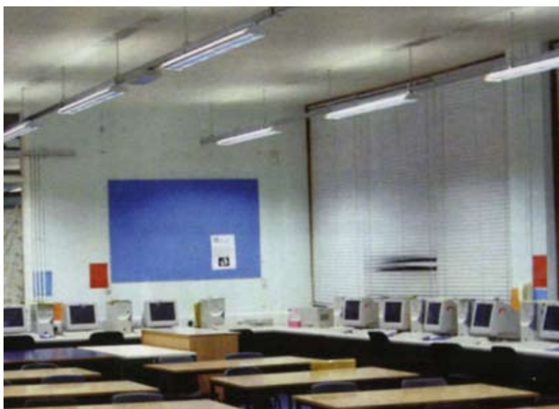
Εικ. 3 Υλοποίηση με άμεσο-έμμεσο φωτισμό

Μελέτες σε εργασιακούς χώρους έχουν δείξει ότι ένας σωστά φωτισμένος χώρος έχει μεγάλη επίδραση στην αποδοτικότητα των εργαζομένων, πόσο μάλλον σε ένα σχολείο. Οι τελευταίες έρευνες και εφαρμογές έχουν αποδείξει πως η χρήση φωτιστικών σωμάτων με άμεσο και έμμεσο φωτισμό μπορεί να δώσει τη λύση, καθώς επιτυγχάνουμε την ομοιομορφία στην κατανομή αλλά και το επιθυμητό ανακλώμενο φως από την οροφή του χώρου (Εικ. 3). Οπωσδήποτε, ανάλογα με το είδος της διδασκαλίας υπάρχουν και ειδικότερες απαιτήσεις και ανάγκες εστιακού φωτισμού στο χώρο, οι οποίες πρέπει να μελετώνται κατά περίπτωση.